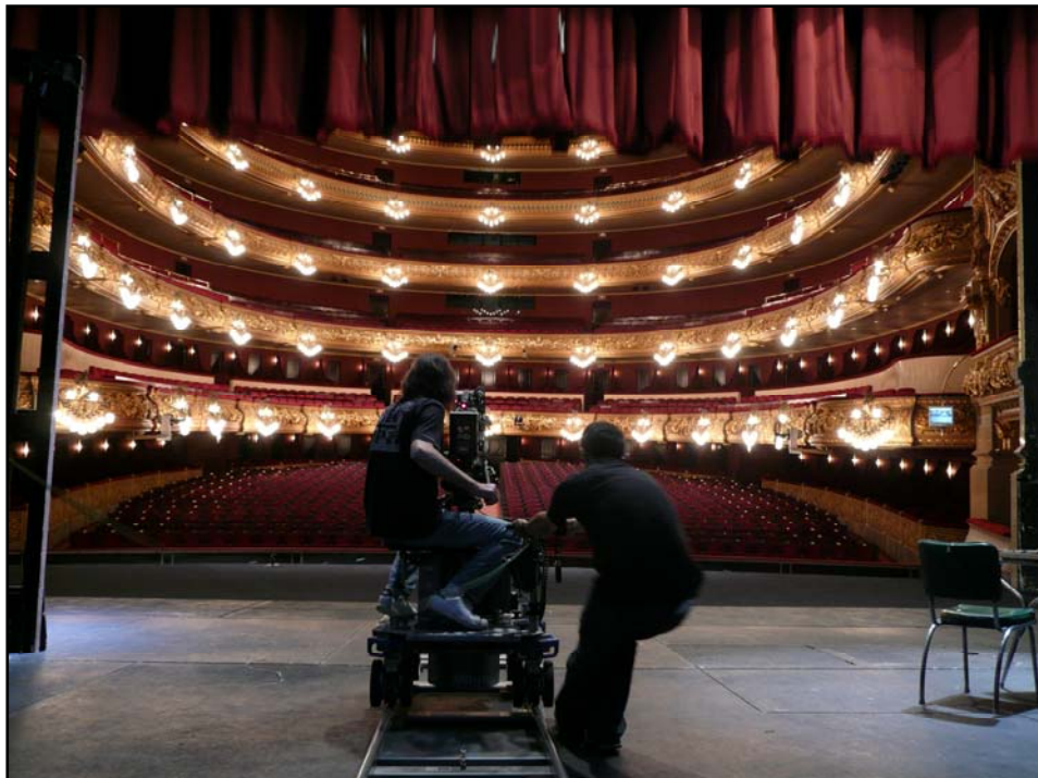
> Filmació al Gran Teatre del Liceu.

En aquella Barcelona dominada pel Gran Teatre del Liceu, a on els canvis socials no havien transformat l'esperit ni de l'espectacle ni de l'indret. Una Barcelona –la de 1893— modernista, culta, amb una burgesia preocupada per deixar una petjada perenne a la ciutat, per inventar un nou estil arquitectònic pròxim al simbolisme que trenca les simetries de les formes i que és la llavor de cert Modernisme; a moments és gairebé una necessitat de reinventar-se com a puixant en el poder. Però que també feia cas omís a qualsevol tipus de reivindicació social, amb fortunes que tenien els seus orígens en el tràfic d'esclaus i negocis comercials de diferents tipus i procedència.