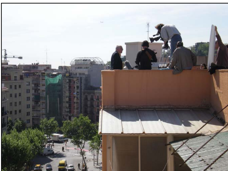
> Equip de «La Bomba del Liceu» durant el rodatge.