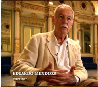
EDUARDO MENDOZA escritor