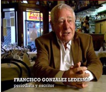
FRANCISCO GONZÁLEZ LEDESMA periodista y escritor